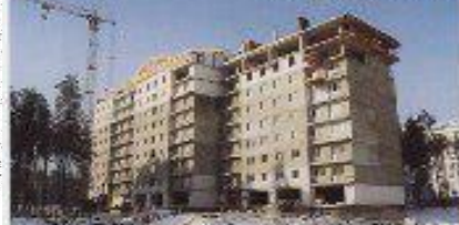
Сдаются в эксплуатацию летом 2010 года

Срок сдачи в 2011 году Сданы/будут сданы в эксплуатацию